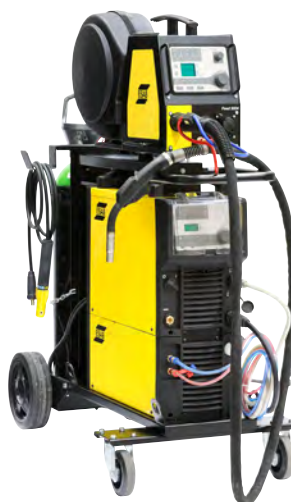
Источник с блоком охлаждения