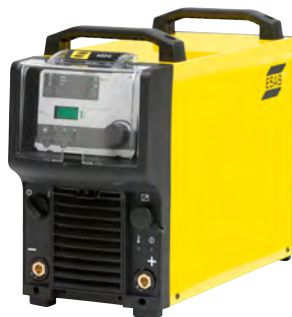
Origo™ Mig 4004i, A44

Выбирая режим управления напряжением дуги MIG/MAG, вы можете добиться лучшей производительности, и исключить гашение дуги.