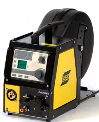
Origo™ Feed 3004