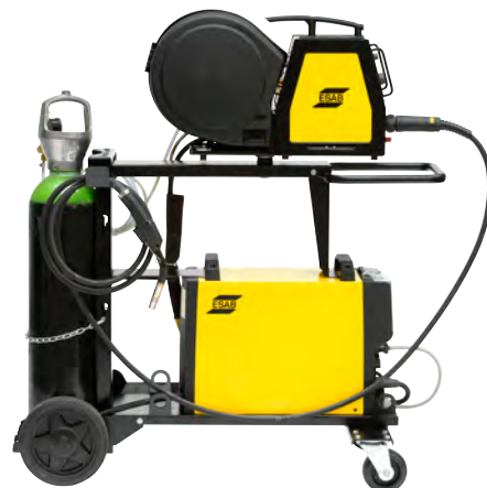
Источник без блока охлаждения

За дополнительной информацией обращайтесь в офисы ООО «ЗСАБ»: