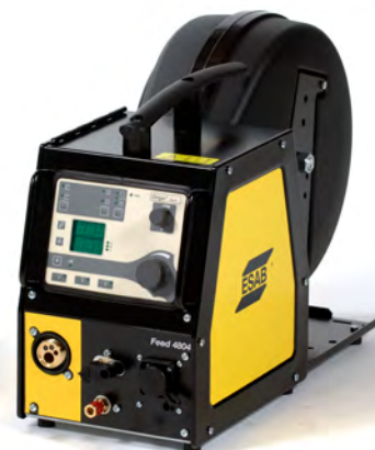
Origo™ Feed 4804